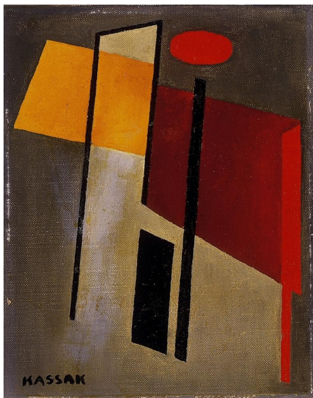
Kassák Lajos: Kompozíció

Az 1910-es évtized végére Kassák műhelyében már kialakult az expresszionizusból és még inkább a konstruktivizusból elkülönülő aktivizmus. Ebben az irányzatban a társadalmi és technikai haladás eszméi szólaltak meg, a népköltészet és a városi műdal stíluselemeit is befogadva. Az aktivizmus alapelve szerint a művészet: tett. Ez az irányzat a világot technicista látószögből szemléli. A művész a társadalom vezére, "kollektív individuum", a romantikus vátesz modern utóda. Az aktivista stílus: didaktikus, színpadias, agitatív.