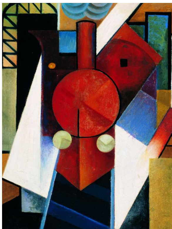
Bortnyik Sándor: Vörös mozdony (1918)

Bortnyik Sándor (1893 - 1976) festő, grafikus, az aktivisták mozgalmának kiemelkedő tehetségű tagja volt. 1918-ban csatlakozott a Kassák-körhöz, részt vett a Ma kollektív kiállításán. Később a folyóirat rendszeresen közölte grafikáit, és még 1920 után is a Ma munkatársa maradt, amikor Bécsbe emigrált. Hazatérte után (1925), 1928—1938-ban Műhely néven grafikai magániskolát nyitott, ahol a Bauhaus elvei szerint tanított. 1949 és 1956 között a Magyar Képzőművészeti Főiskola igazgatója volt.