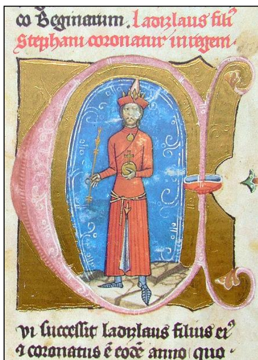
Kun László - a Képes Krónikában

A fentebb elmondottak figyelembevételével próbálom meg a Habsburgok és Magyarország viszonyát bemutatni. Jóllehet végleges kapocs csak 1526-ban jött létre a Habsburg család és Magyarország között, valójában ez a kapcsolat ennél jóval régebbi. Már az első Habsburg, Rudolf, sokat köszönhetett a magyaroknak, nevezetesen az akkori magyar királynak, Kun Lászlónak, akinek a segítségével kétséges, hogy megnyerte volna hatalmas ellenfele, Ottokár ellen vívott döntő ütközetet 1278-ban Morvamezőnél. Azt sem szabad elfeledni, hogy Magyarország számára Ottokár akkor jóval nagyobb veszélyt jelentett, mint a Habsburg. A XIV. században már kis híján házassági kapocs jön létre az akkori magyar