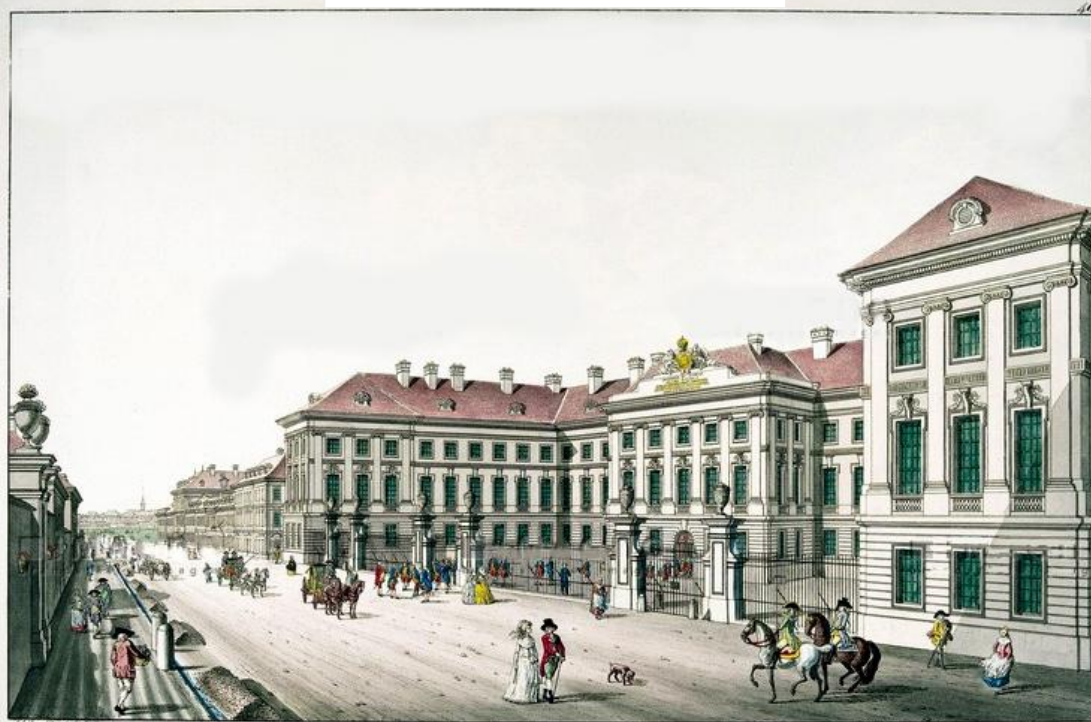
IOSEPHINISCHE MEDICO CHIRURGISCHE MILITAIR ACADEMIE und Gewehr-Fabrik in der Währinger Gasse